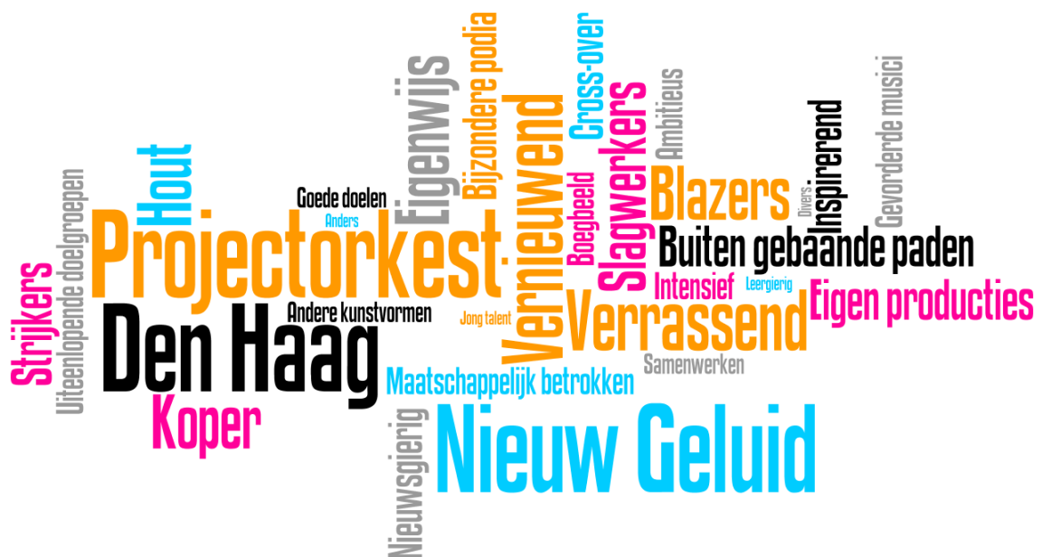
Figuur 1: Over Nieuw Geluid

Stichting Nieuw Geluid is opgericht op 13 september 2011 in Den Haag door drie klassiek geschoolde amateurmuzikanten. Ze waren op zoek naar vernieuwende vormen van muziekbeoefening die ze in het bestaande cultuuraanbod en verenigingscultuur in de Haagse regio niet aantreffen. Zie figuur 1 voor een grafische weergave wat Nieuw Geluid kenmerkt.